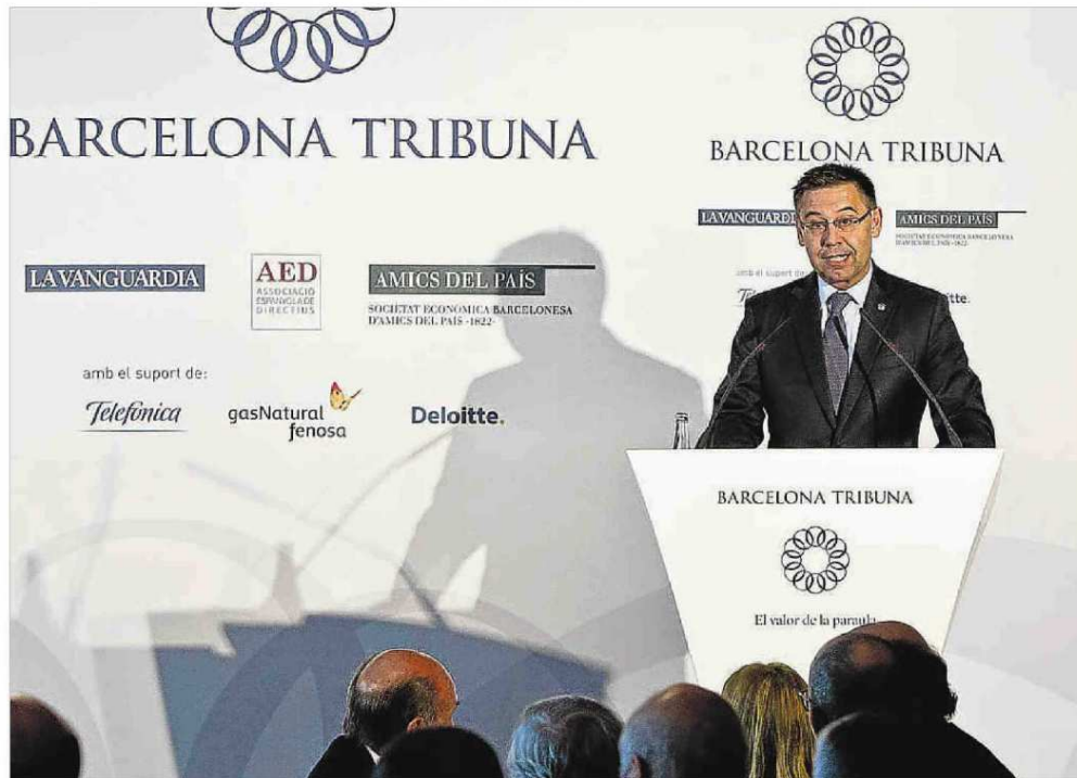
Josep Maria Bartomeu durante su conferencia en Barcelona Tribuna sobre el impacto del FC Barcelona en el mundo