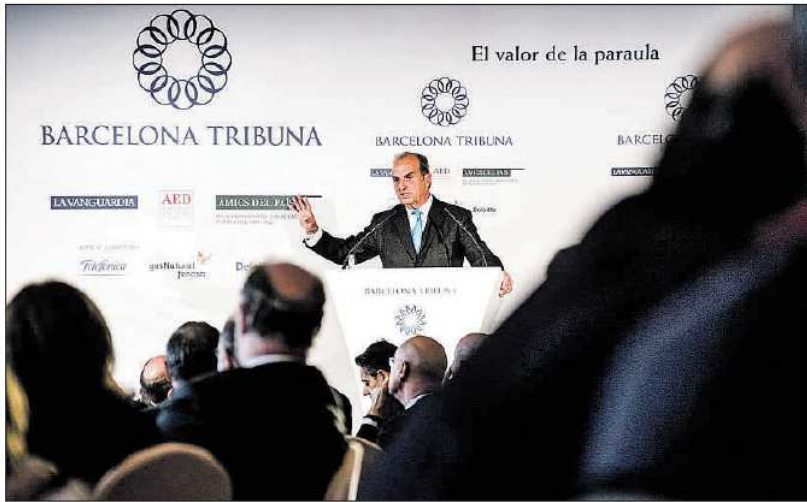
El presidente de Foment del Treball, Joaquim Gay de Montellà, ayer durante su intervención en Barcelona Tribuna